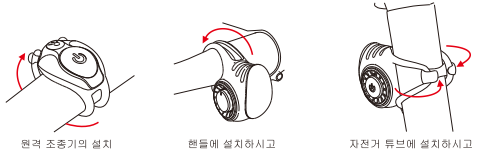
원격 조종기의 설치